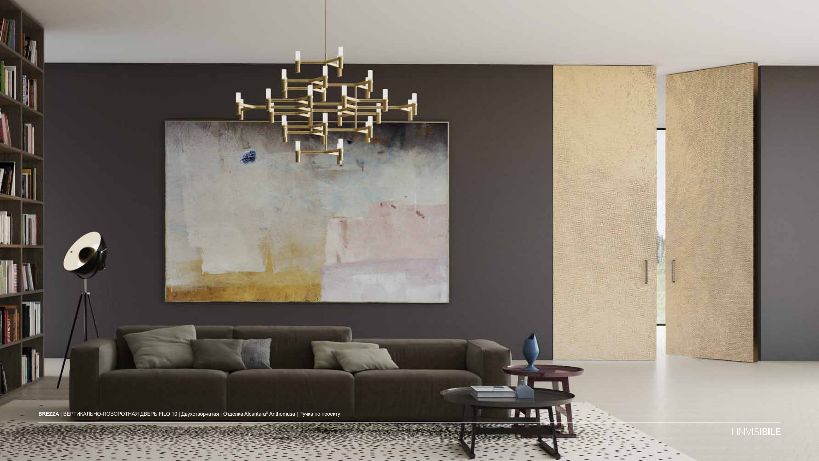
BREZZA | ВЕРТИКАЛЬНО-ПОВОРОТНАЯ ДВЕРЬ FILO 10 | Двухстворчатая | Отделка Alcantara® Anthemusa | Ручка по проекту