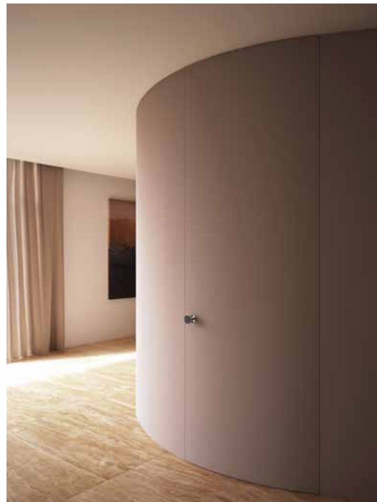
ALBA | РАДИУСНАЯ РАСПАШНАЯ ДВЕРЬ | Покраска в цвет стены

Мы создали широкую и организованную сеть высококвалифицированных специалистов по монтажу дверей по всему миру, обладающих высокими компетенциями и профессионализмом, гарантирующих функциональность и долговечность продукции.