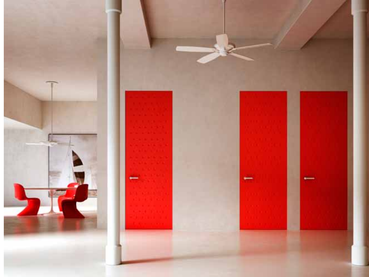
ALBA | MENTEŞELI KAPI | Mat ve pantograf finisaj

Çalışmamızın arkasında, gizli bir deneyim ve eksklüzif tasarımdan oluşan İtalyan tarihi yatar. Kesin teknik teknik bilgi, maksimum düzeyde "özelleştirme" ile birlikte, en talepkar estetik istekleri ve fonksiyonel beklentileri karşılamaya imkan veren, duvarla bütün kapının gözle görülür basitliği ile maskelenmektedir.