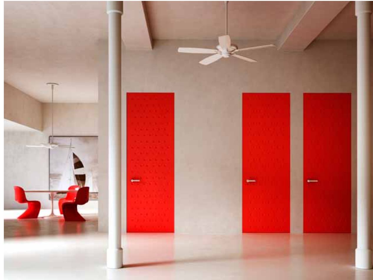
ALBA | PORTE À BATTANTE | Finition laqué et avec pantographe

Derrière notre travail se trouve toute une histoire italienne cachée racontant l'expérience et le design exclusif. Le savoir-faire technique précis est masqué par l'apparente simplicité de la porte à fleur de mur fini qui, combinée avec un niveau maximal de « personnalisation », afin de satisfaire les plus hauts niveaux de désirs esthétiques et d'attentes fonctionnelles.