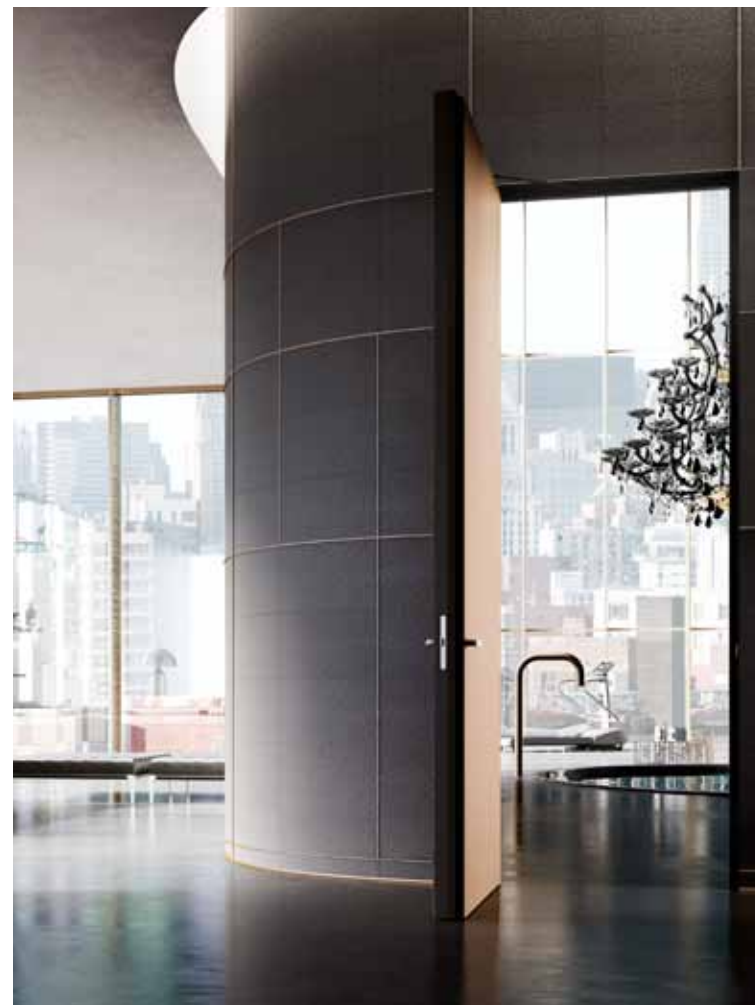
ORIZZONTE | Finitura pelle di squalo nera Sistemi boiserie e battiscopa in continuità con la parete

Offriamo una capillare e organizzata rete di squadre di posatori specializzati, presente su tutto il territorio nazionale, che operano con competenza e professionalità per garantire le migliori prestazioni estetiche, funzionali e di durabilità dei prodotti.