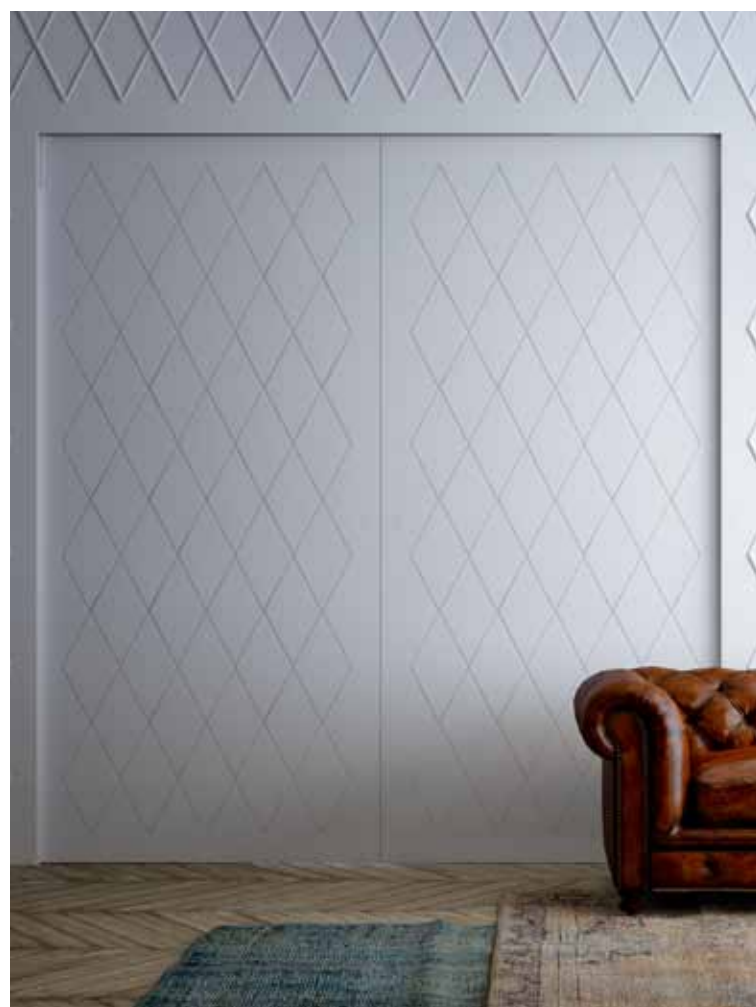
MAREA | РАЗДВИЖНЫЕ ВДОЛЬ СТЕНЫ | версия с двумя створками Пантографированная поверхность | Отделка матовым лаком | Скрытая ручка

Мы создали широкую и организованную сеть высококвалифицированных специалистов по монтажу дверей по всему миру, обладающих высокими компетенциями и профессионализмом, гарантирующих функциональность и долговечность продукции.