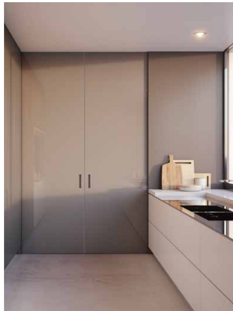
MAREA | PORTES COULISSANTE AU CENTRE DE LA CLOISON À 2 vantaux | Finition laqué brillante | Poignée encastrée

Notre réseau étendu et bien organisé d'équipes d'installateurs spécialisés est présent dans tout le pays; leur expérience et leur professionnalisme sont à votre service afin de garantir que nos produits sont beaux esthétiquement, fonctionnels et très robustes.