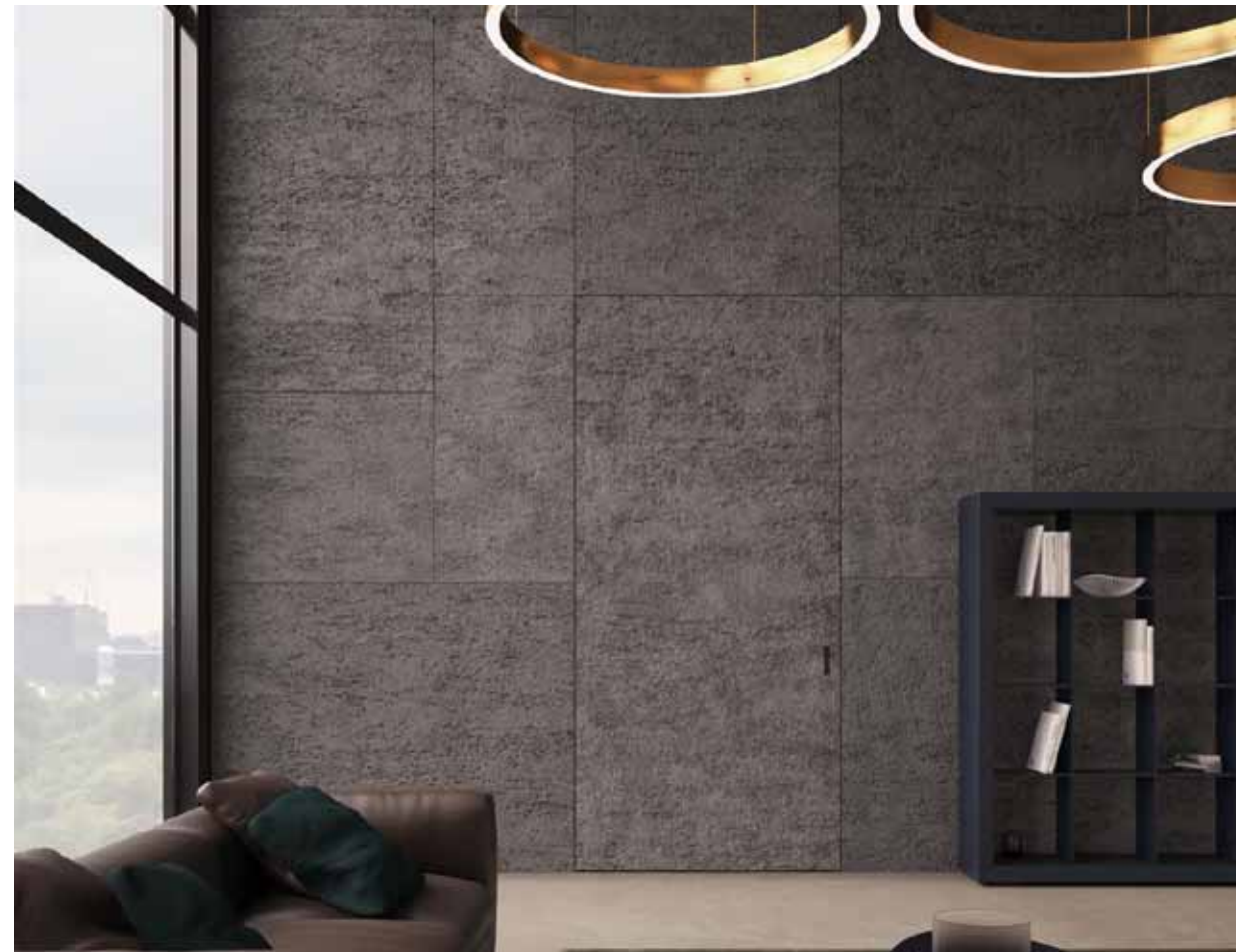
MAREA | PORTE COULISSANTE ESCAMOTABLE | Version manuelle | Finition pierre | Système Boiserie en continuité avec la cloison

Derrière notre travail se trouve toute une histoire italienne cachée racontant l'expérience et le design exclusif. Le savoir-faire technique précis est masqué par l'apparente simplicité de la porte à fleur de mur fini qui, combinée avec un niveau maximal de « personnalisation », afin de satisfaire les plus hauts niveaux de désirs esthétiques et d'attentes fonctionnelles.